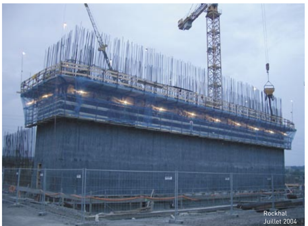
Rockhal Juillet 2004

LE 19 JUIN 2005, LA ROCKHAL CRÉE L'ÉVÉNEMENT POUR LA FÊTE DE LA MUSIQUE. COMME CHAQUE ANNÉE, LA FÊTE DE LA MUSIQUE REVIENT AVEC LE PRINTEMPS. CETTE ANNÉE PRENDRA CEPENDANT UN CARACTÈRE PARTICULIER AVEC, EN AVANT PREMIÈRE DE SON INAUGURATION OFFICIELLE PRÉVUE POUR L'AUTOMNE PROCHAIN, UNE OUVERTURE EXCEPTIONNELLE DE LA ROCKHAL AU PUBLIC À L'OCCASION DE LA FÊTE DE LA MUSIQUE. PAS MOINS DE SEPT SPECTACLES MUSICAUX VOUS ATTENDENT DE 15H30 À 24H00 POUR OFFRIR AU PUBLIC UN AVANT-GOÛT DE LA PROGRAMMATION À VENIR POUR LES PROCHAINES SAISONS.