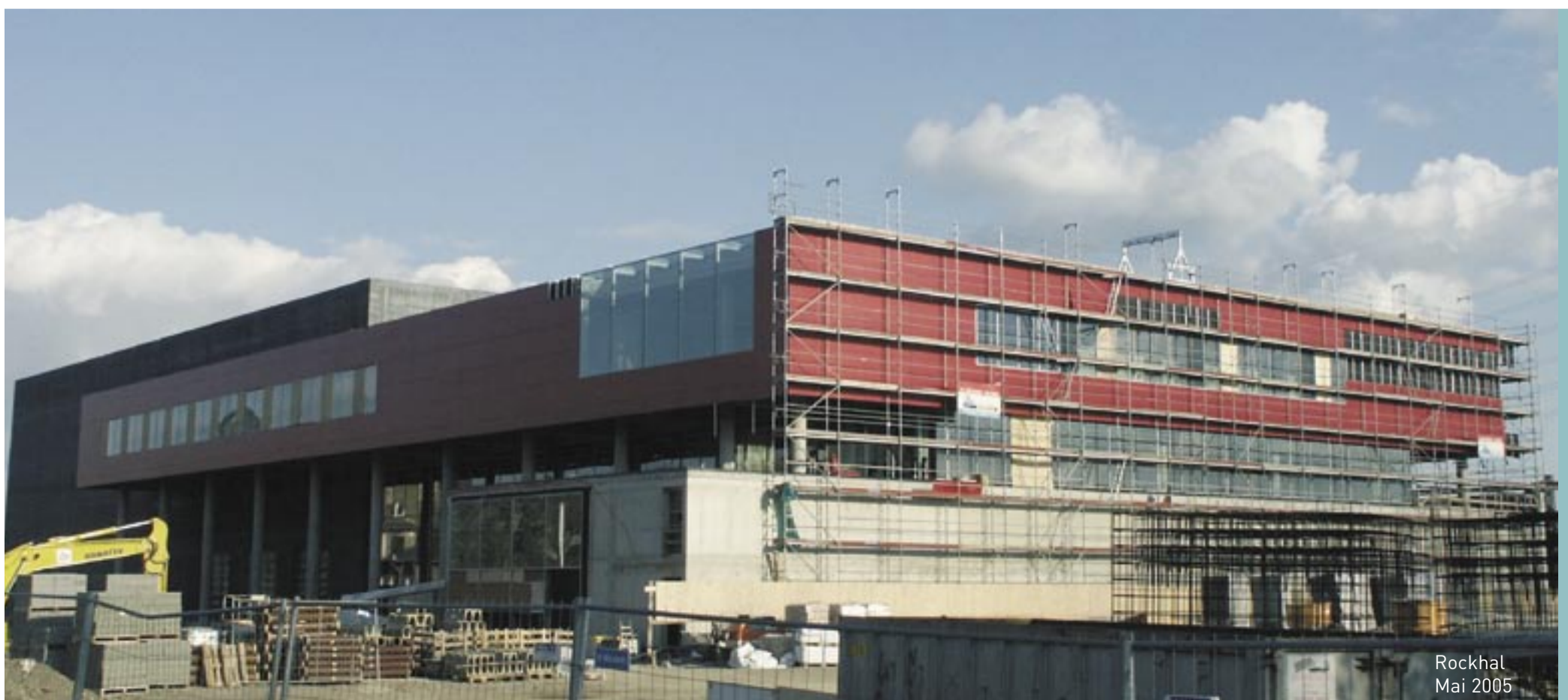
Rockhal Mai 2005