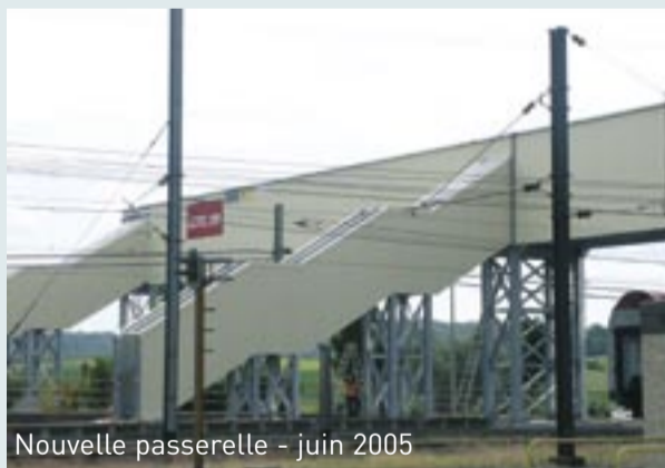
Nouvelle passerelle - juin 2005

FÊTE DE LA MUSIQUE_05 ESCH/BELVAL 19. JUIN